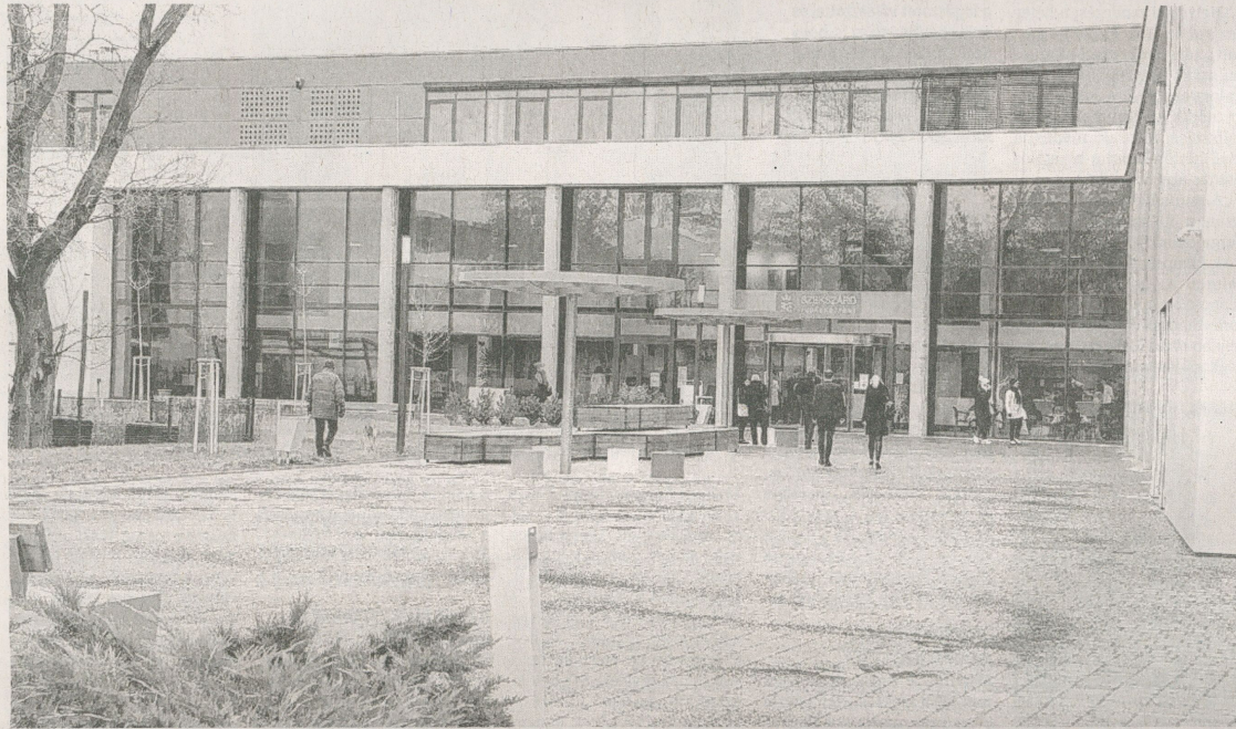
Szekszárdi Tudásközpont: a forma és funkció maradéktalan összhangját valósítja meg az impozáns épület

Ünnepélyes keretek között avatták fel a Szekszárdi Tudásközpont épületén az Építőipari Nívódíj emléktábláját kedden délelőtt. Az odaítélt elismerés a ZÁÉV Építőipari Zrt. kivitelezésében megvalósult projekt kiemelkedő műszaki és építészeti színvonalát igazolja.