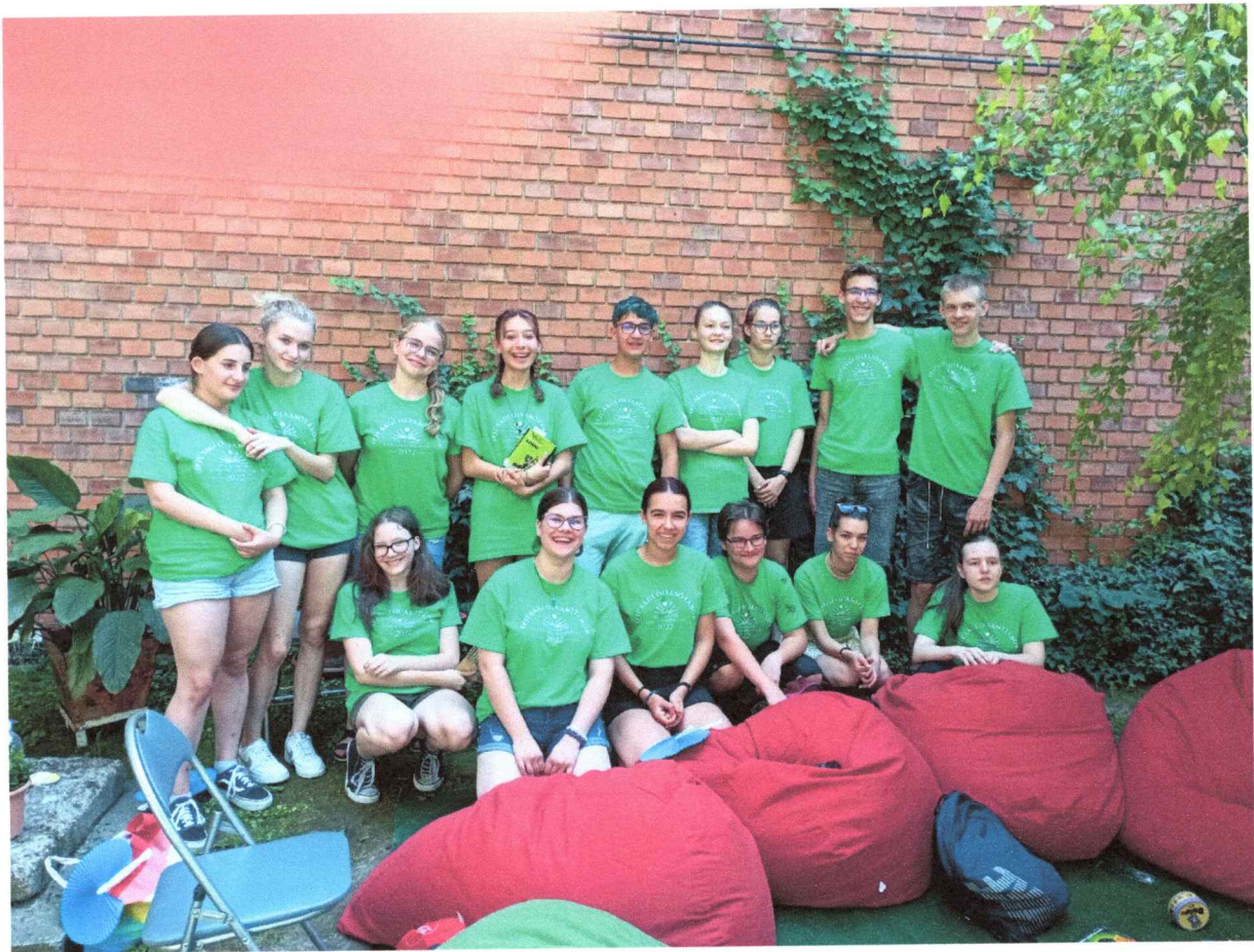
A csapat- mindjárt indul a felfedezőútúra