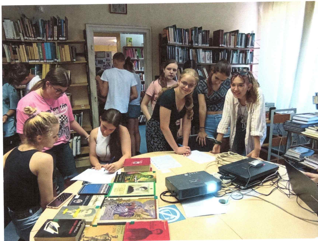
Petőfi 200 – vetélkedő- helytörténeti különgyűjtemény