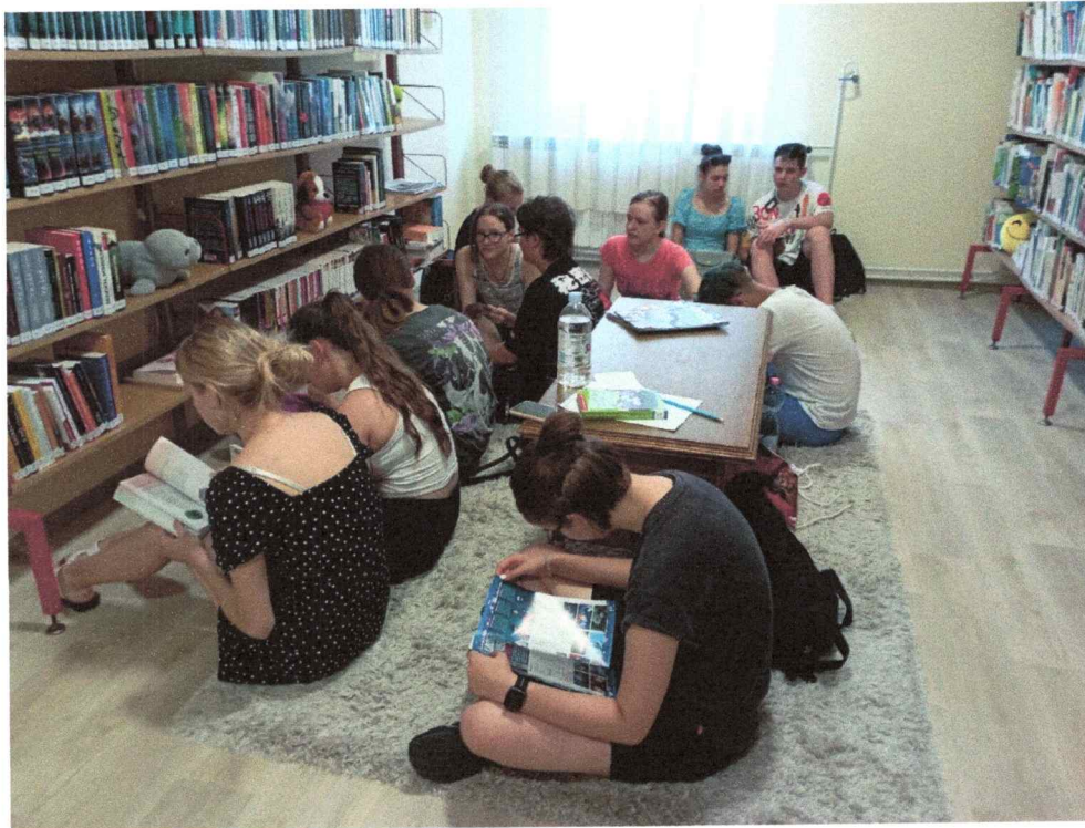
Az ODÚ-ban a klubtagokra várva