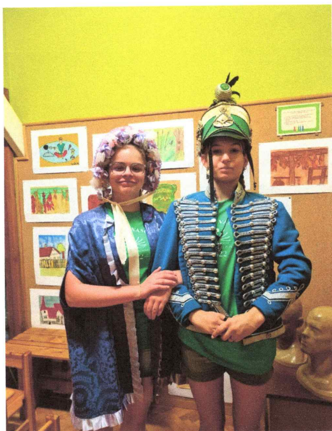
Beöltözés a múzeumban