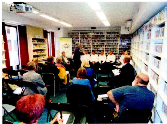
Szekszárdi Muslinca Kórus