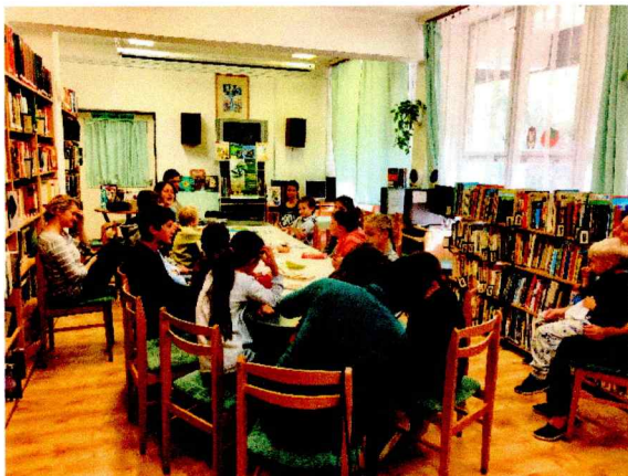
Madárbarát Könyvtári Kör