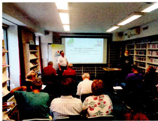
Baka György Zöldtárs Alapítvány