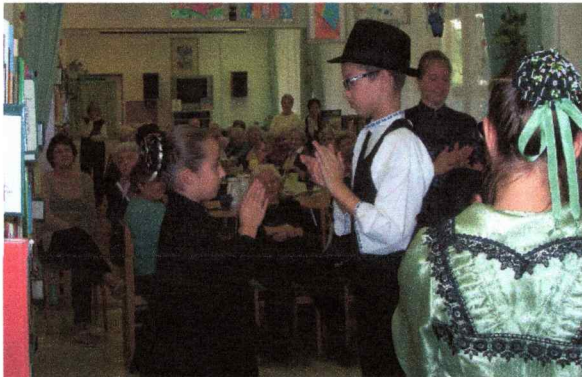
Ifjú Szív Német nemzetiségi néptánc egyesület