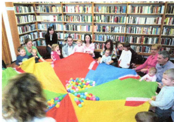
Skicc Bt. – Paks